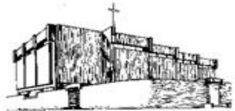
Mutter vom Guten Rat