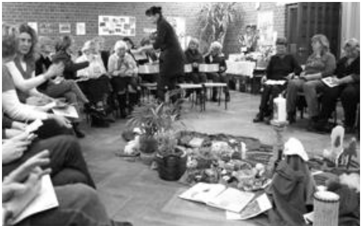
Bild: Mit einer symbolischen Brotverteilung wurde veranschaulicht, wie viel Nahrung in den reichen Ländern vorhanden ist und mit wie wenig die Armen auskommen müssen.

Der Weltgebetstag 2012 kommt aus Malaysia und hat das Thema: „Let Justice Prevail“.